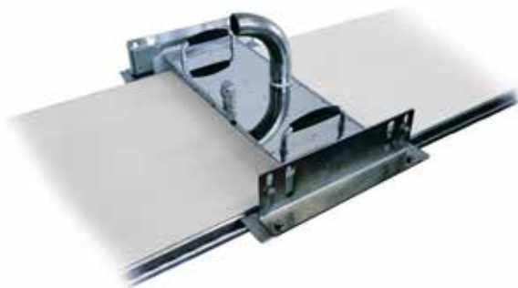
on top of the belt - montaggio sulla parte superiore

regulations on Haccp and environmental impact. Powered by a Menikini Industrial Steam Generator that delivers up to 680 g/min of steam, it can be easily mounted both on the top of the belt and on the bottom and is available in different sizes. The dry steam is delivered directly onto the belt and at the very moment of contact it easily dissolves both the dirt and the residues of the product being processed. It cleans deeply, because it penetrates the micropores of the surface. The integrated suction chamber eliminates dirt, leaving the belt dry, clean and sanitized.