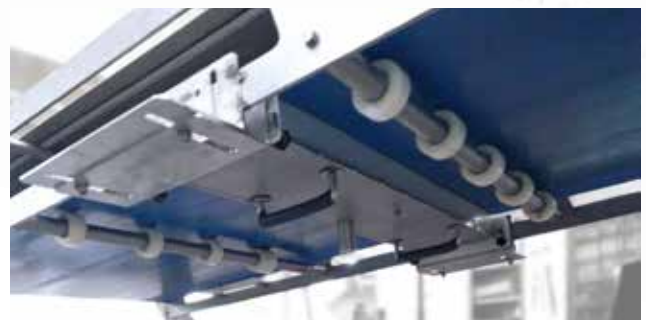
under the belt - montaggio sulla parte inferiore